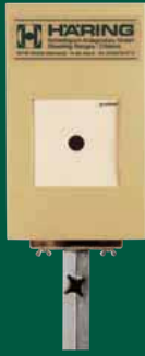
Elektronische Scheibenanlage 10 m ESA 10