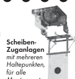
Scheiben- Zuganlagen mit mehreren Haltepunkten, für alle Montagearten

Postfach 1140 · D-35086 Battenberg Tel. (0 64 52) 93 32-0 · Fax: (0 64 52) 93 32-163 E-mail: info@johannsen.de Internet: www.johannsen.de