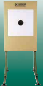
Elektronische Scheibenanlage 25/50/100 m ESA 25 ESA 50 und ESA 100