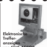
Elektronische Treffer- anzeigen von SIUS-ASCOR

Ein Begriff für perfekte Schießstand- technik